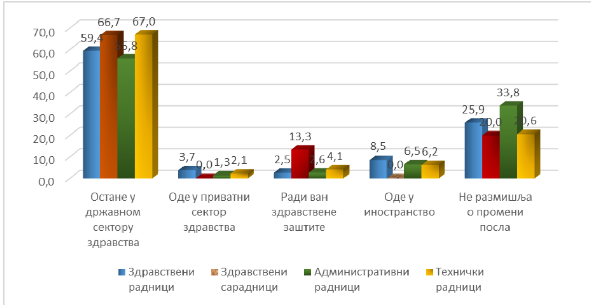
Графикон 3 Планови запослених вазани за промену посла

Када размишљају о послу у наредних пет година ( Графикон 3 ): 60,2% би остало у државном сектору здравства и то : здравствених сарадника ( 66,7%, претходне године 54,5%), здравствених радника ( 59,4%, претходне године 60,8%), административних ( 55,8%, претходне године 47,15) и техничких радника ( 67,0%, претходне године 54,5% ). О промени посла не размишља 25,8% запослених, и то највише административних и здравствених радника ( 33,8%, односно 25,9% ), као и сваки пети технички радник ( 20,6% ) и здравствени сарадник ( 20,0% ). Послове ван здравствене заштите радило би 3% запослених ( претходне године 4,5% ), и то : 13,3% здравствених сарадника ( претходне године 3%), 4,1% техничких радника ( претходне године 2,5%), 2,6% административних ( претходне године 3,5%) и 2,5% здравствених радника ( претходне године 5%). У приватни сектор би отишло 3,2% ( претходне године 3,2% ), запослених и то: 3,7% здравствених радника ( претходне године 3,7% ), техничких 2,1% ( претходне године 1,3%) и 1,3% административних радника ( претходне године 1,2% ) и ниједан здравствени сарадник ( претходне године 3% ). У иностранство би отишло 7,8% анкетираних и то: 8,5% здравствених радника, 6,5% административних и 6,2% техничких радника, а ниједан здравствени сарадник.