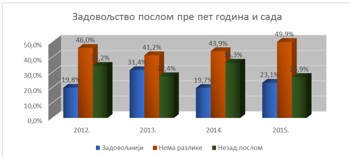
Графикон 2 Процена задовољства послом запослених у односу на период од пре пет година

У поређењу са периодом од пре пет година 23,1% запослених је задовољније послом, 49,9% сматра да нема разлике, а 26,9% је сада незадовољније послом (Графикон 2). У односу на претходну годину за 3,4% је повећан број задовољних, а број незадовољних смањен за 9,4%. У ДЗ Медвеђа 29,8% запослених је сада задовољније послом у односу на период од пре пет година ( претходне године 26,8% ), Власотинце 29,5% ( претходне године 32,6% ), Лебане 29,4% ( претходне године 9,7% ), запослених је сада задовољније послом у односу на период од пре пет година, док је у : Лесковцу 21,7% ( претходне године 19,3% ) и Бојнику 13% ( претходне године 12,2% ), задовољније. У односу на претходну годину, мањи је проценат незадовољнијих : у Лесковцу 27,5% ( претходне године 40,1% ), у Лебану 27,1% ( претходне године 36,9% ), у Медвеђи 8,5% ( претходне године 16,1% ), Бојнику 48,1% ( претходне године 48,8% ) и у Власотинцу 20,0% ( претходне године 20% ).